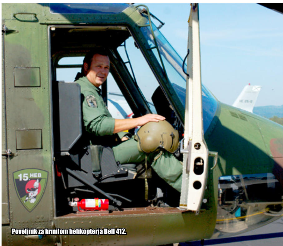
Poveljnik za krmilom helikopterja Bell 412.

Čarovnica spremlja letalske enote vse od vojne za samostojno državo. Čarovnica je bila prvi znak letalske enote TO, kasneje 15. brigade vojaškega letalstva, in tudi ob preoblikovanjih letalskih enot ta ostaja naš prepoznavni znak. To še ne pomeni, da znamo čarati, so pa naše naloge, zmogljivosti in sposobnosti zelo blizu simbolom našega znaka.