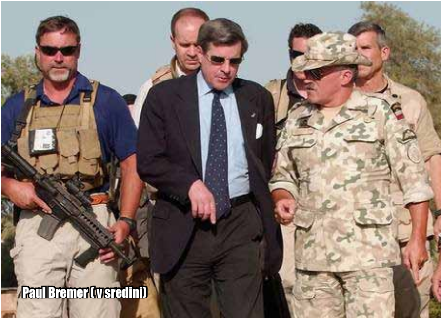
Paul Bremer (v sredini)