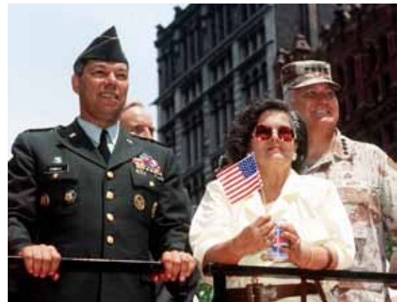
Collin Powell (levo) in Norman Schwarzkopf (desno).

Pred meseci je časopis New York Times objavil intervju z aktualnim poveljnikom sil ISAF ter istočasno s poveljnikom vseh ameriških sil v Afganistanu (USFOR-A), z generalom Joseph Dunfordom. Intervju sam po sebi ne bi bil nič posebnega, če ne bi vseboval pomembnega sporočila, ki ga je general skušal povedati javnosti. V uvodu članka je namreč povedal, da »... koalicija pod vodstvom Američanov nima več cilja spremeniti Afganistana, njen fokus je sedaj mnogo ožji – pripraviti afganistanske varnostne sile za obrambo pred Talibani, ne glede na vse politične in ekonomske probleme v državi«. Ali kot se je v preprostem vojaškem jeziku general izrazil v svojih smernicah pripadnikom ISAF: »COIN is over!« (Protiuporniška strategija je končana.)