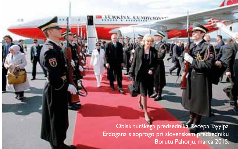
Obisk turškega predsednika Recepta Tayyipa Erdogana s soprogo pri slovenskem predsedniku Borutu Pahorju, marca 2015.