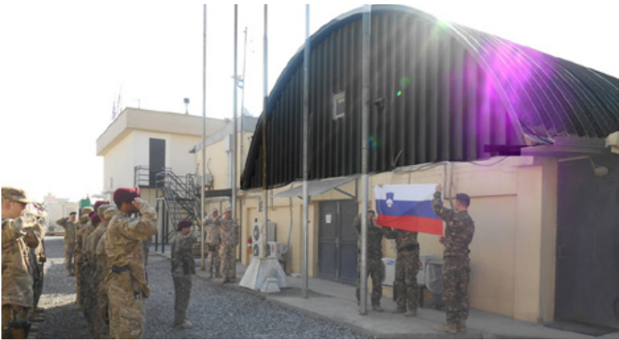
Dvig slovenske zastave v poveljstvu CSOTF-10, Camp Vose, Kabul (oktober 2013).

čevalno-taktično situacijo v provinci, z geografsko razporeditvijo sil CSOTF-10, z razporeditvijo konvencionalnih koalicijskih sil in afganistanskih varnostnih sil (Afghanistan Security Forces ali ANSF) ter z njihovimi zmogljivostmi.