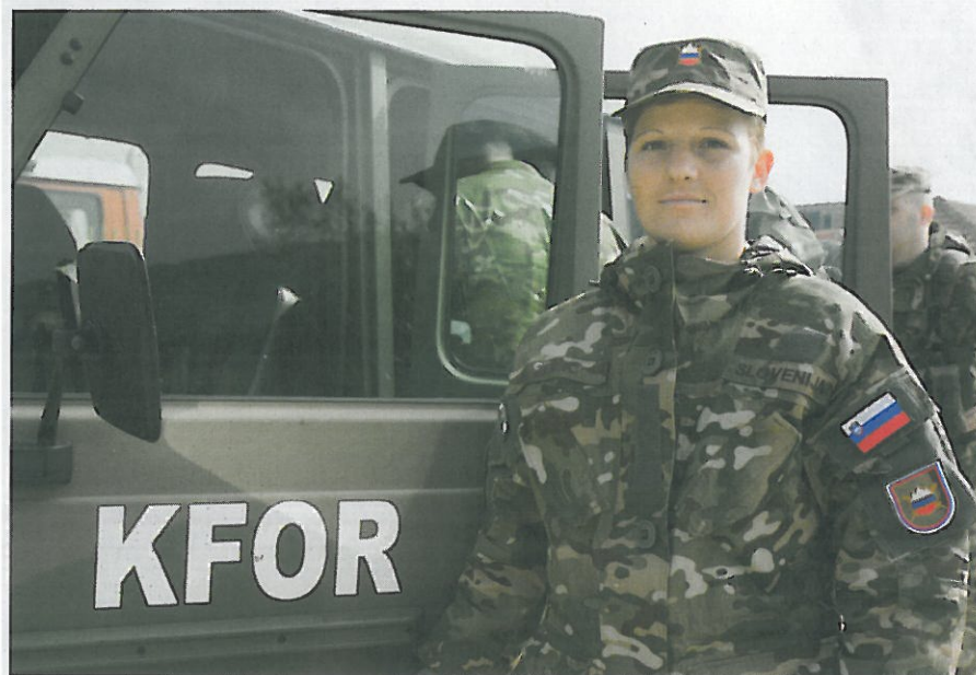
Karmen je uresničila svoje sanje, čeprav domačim ni bilo čisto prav.

svoje ženskosti gotovo omejene,« pove prva, ki je bila na misiji že večkrat. »Te so enake, uniforme namreč, kot jih nosijo moški. Z njo skrijemo žensko v sebi. Sploh pa počnemo enake stvari kot vojaki, razlik v zahtevnosti ni. Ne ukvarjam se s tem, da sem ženska v moškem okolju.« Do sebe, svojega poklica in okolice ima trezen ženski pristop. Ženski zato, ker ne pozabi, da to je, čeprav tega ne razglašala. Kajti ko se po misiji vrne domov, se pogleda v ogledalo, natakne uhane, a ko je tukaj, v Peči pri Kosovu, je vojakinja, ki ne joka, ki v svojo vojaško sobo ne nosi spominkov od doma, le tu in tam pogleda fotografije svojih dragih, če jih pogreša.