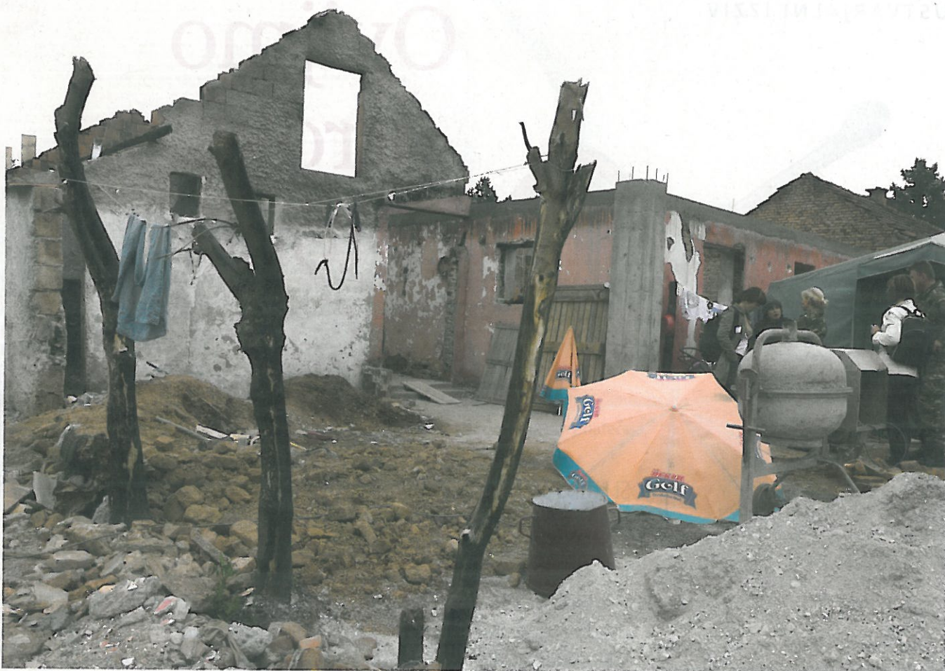
Vojska ne pomeni vojne. Vojska pomeni tudi humanitarno delo. Tukaj z družino, ki ji je požar uničil hišo.

težav, omeni moški frontalni »napad« in žensko delo iz ozadja.